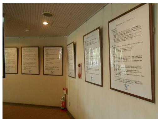
【図 1-2-1 建学の精神等の掲示（管理棟 1 階入口付近）】

次に、学外に対する周知方法は、大学案内及びホームページを活用している（【資料 1-2-4】、【資料 1-2-5】）。加えて、学生募集要項に建学の精神・基本理念（教育理念）等を明示することにより、志願者に配慮している（【資料 1-2-6】）。なお、建学の精神・基本理念（教育理念）については、志願者にわかりやすい文面にしたうえで掲載している。