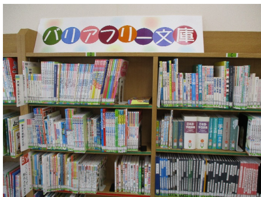
【図2-5-1 バリアフリー文庫】

さらに、平成31（2019）年4月より学内外に新聞の魅力伝える新聞講座を静岡新聞社と連携して開始した。具体的には、静岡新聞社社員を講師とした、本学の学生及び外部の図書館利用者を対象とした「新聞カフェ」である（【資料2-5-13】）。