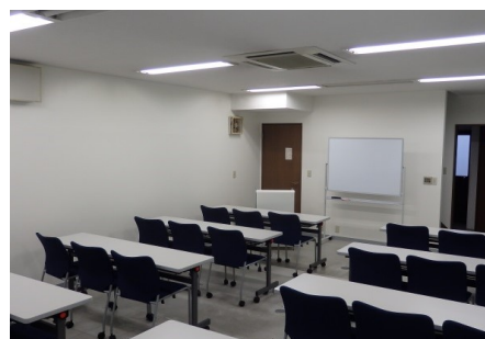
【図 A-1-2 サテライトキャンパス1階】