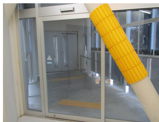
【図 2-5-4 緩衝材設置箇所】

なお、大教室のうち1教室は、スライディングウォールによる区画により受講生数に応じた教室サイズへの変更が可能で、教室の有効活用を行っている。