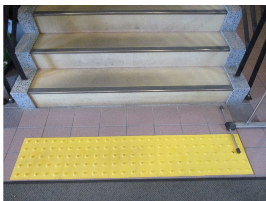
【図 2-5-3 点字ブロック】

令和2（2020）年4月の全盲の視覚障がい者の入学に伴い、各建物内の点字ブロックの設置及び危険箇所への緩衝材の設置を行った。