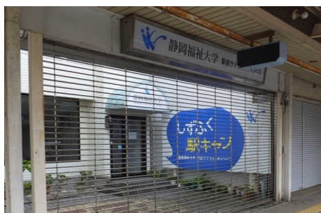
【図 A-1-1 サテライトキャンパス外観】

※焼津駅前サテライトキャンパスとは、JR東海道線焼津駅南口にある「焼津駅前通り商店街」の空き店舗を本学が利用している施設であり、焼津市の課題である中心市街地活性化及び若者の賑わい創出の解決を図るためのものである。