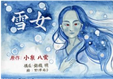
紙芝居『雪女』／原作：小泉八雲 構成：錦織明 絵：野澤尚子