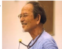
平成17年6月13日

また、八雲八雲原作の日本初の防災教材である 「いなむらの火」の防災の心を広めようと、 (公社)シャンティ国際ボランティア会(SVA)が 現地の人が制作した「防災紙芝居」の監修を行 う。国際協力のNGOの要請で、1995年より ラオス、アフガニスタン、カンボジア、ミャン マー(ビルマ)難民キャンプ、ミャンマーに研 修の講師として訪問し、紙芝居を広めている。 第34回五山賞奨励賞受賞。