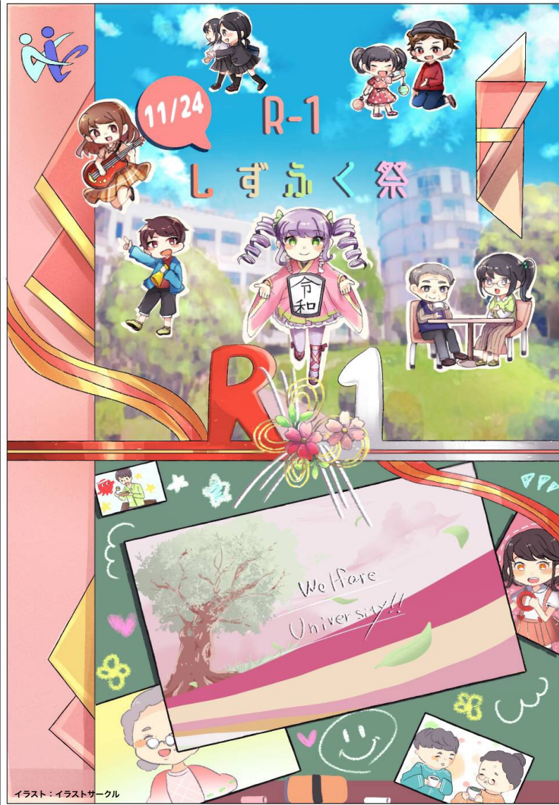
イラスト：イラストサークル